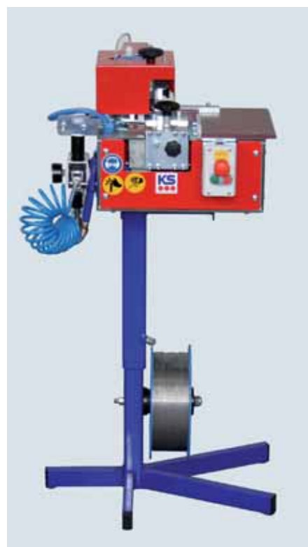
KS Ropam avec pied réglable individuellement à la hauteur de travail de l'opérateur.

Possibilité de réaliser env. 64.000 agrafages avec un seul rouleau de fil.